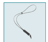
Leather Strap O-ST24