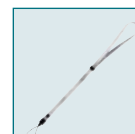
Sport Strap O-ST30