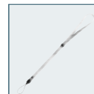
Sport Strap O-ST30