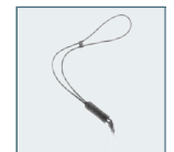
Leather Strap O-ST24